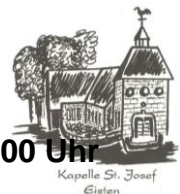
Kapelle St. Josef Eisten